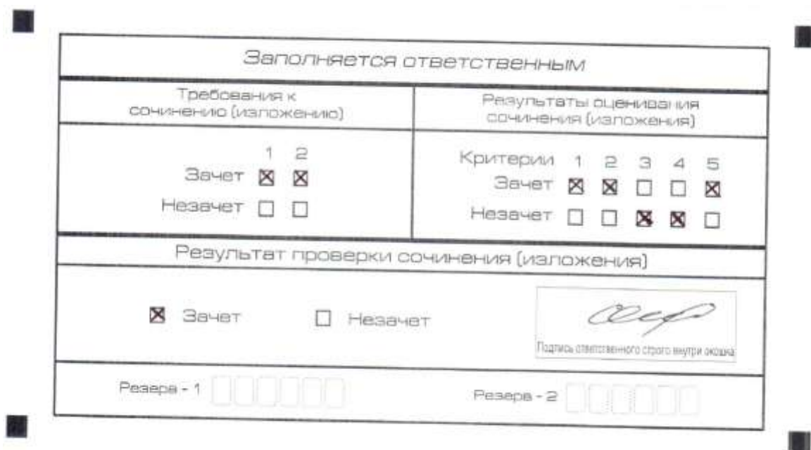
Рис. 8. Область для оценки работы

3. Во всех остальных случаях сочинение (изложение) проверяется по всем пяти критериям и оценивается по системе «зачет»/«незачет» (например, нельзя не проверять работу по критериям К4 и К5, если выпускник получил зачет на основании зачетов по критериям К1, К2, К3).