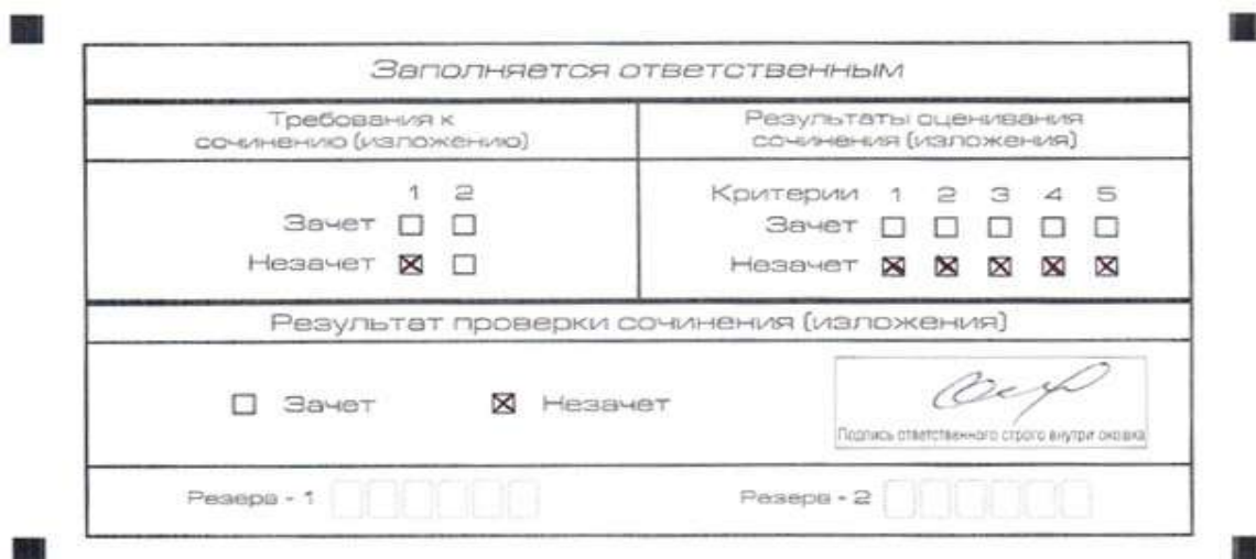
Рис. 7. Область для оценки работы

Эксперт комиссии (ответственное лицо, технический специалист 1 ) выставляет «незачет» за невыполнение требования № 2. В клетки по всем критериям оценивания выставляется «незачет». В поле «Результат проверки сочинения (изложения)» ставится «незачет».